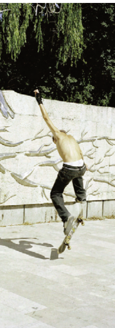
BARAKONYI SZABOLCS (RÉSZLET)