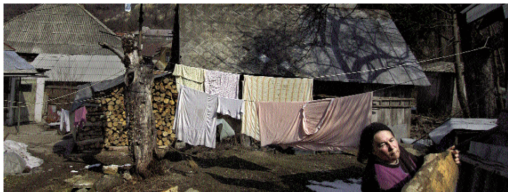
DEZSŐ TAMÁS (RÉSZLET)